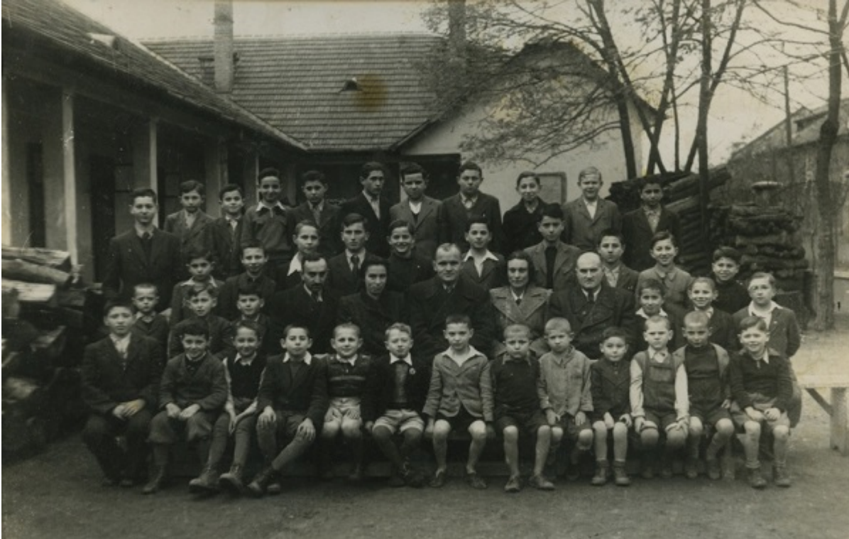
Спасенные праведником еврейские дети в «Школе для детей польских офицеров»