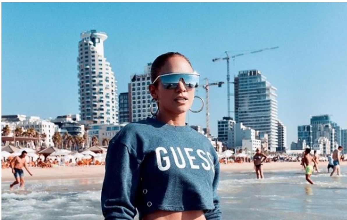
Дженнифер Лопес в Тель-Авиве

Вряд ли этот призыв возымеет действие — музыкант уже вышел за рамки, заявив на днях в эфире вещающего из Газы и контролируемого ХАМАС канала iMetru, что «израильтяне создали и развили систему, при помощи которой был убит темнокожий американец Джордж Флойд».