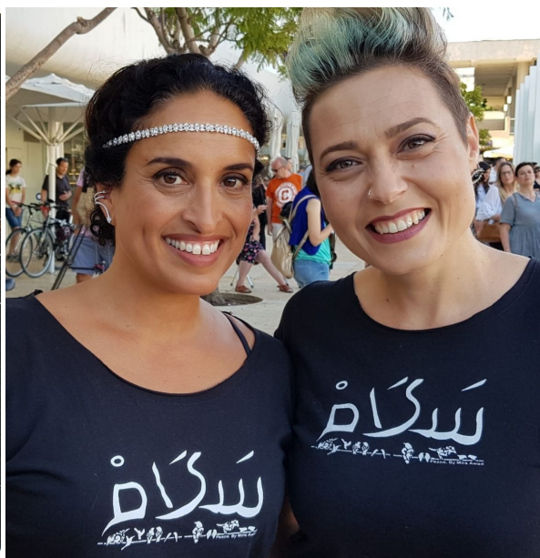
... и в футболках с надписью «Мир»