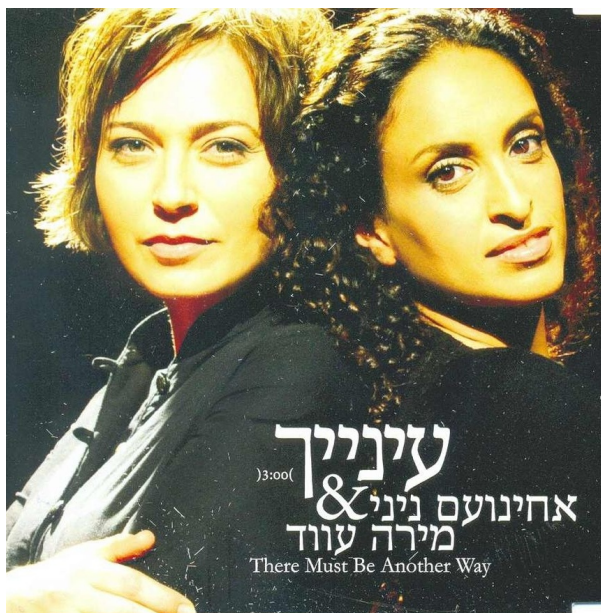
Мири Авад и Ахиноам Нини на обложке совместного альбома

Мири родилась в северной Галилее, ее отец — израильский араб, врач по профессии, а мать — христианка из Болгарии. Петь девочка начала в раннем детстве, в 9 лет дебютировала на большой сцене, исполняя арабскую и болгарскую традиционную музыку, а также популярные композиции своих любимых групп, в том числе Pink Floyd.